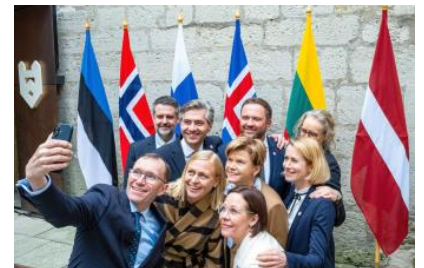
le NB8 s'immortalise

Dans les conflits en cours les positions de l'Islande sont claires : soutien à l'Ukraine face à une Russie considérée comme le principal danger pour l'île ; soutien à la solution à deux états pour ce qui concerne la Palestine. L'Islande est partie dans l'action engagée par l'Afrique du Sud auprès de la Cour Internationale de Justice de l'ONU à l'encontre du gouvernement israélien. « Ce n'est pas une position extrême de dire que les enfants ne devraient pas mourir de faim. Ce n'est pas du radicalisme d'exiger une aide humanitaire, la protection des citoyens et une véritable solution politique. C'est l'exigence minimale ».