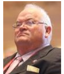
so long ?

« Lorsque j'ai demandé au Président de me confier la responsabilité de l'ICE 1 celui-ci a du mal comprendre puisqu'il m'a nommé Ambassadeur en ICE-land » raconte l'ami de Trump Billy Long. Et à ce mauvais jeu de mots, il joint en une autre occasion ce commentaire : « Jeff Landry a été nommé pour devenir gouverneur du Groenland, je serai celui du 52 ème état des États-Unis ! ».