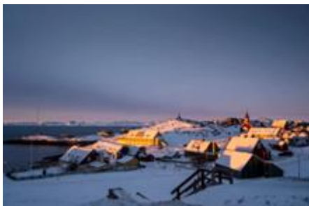
lever de soleil à Nuuk

Trop c'est trop : Þorgerður Katrín Gunnardóttir, ministre des Affaires Étrangères, doit demander des explications : « non c'était une mauvaise plaisanterie entre amis, je fais toutes mes excuses à ceux que cela aurait choqué ! » (voir ici )... À savoir : tous les Islandais ! Une pétition refusant son accréditation a déjà recueilli des milliers de signatures !