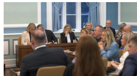
député(e)s en réflexion

Le 22 janvier, à l'Alþingi, pour une fois, les députés sont unanimes sur le constat que la situation mérite réflexion. C'est ce que confirme la ministre Þorgerður Katrín : « le comportement des États-Unis à l'égard du Groenland et du Danemark est inqualifiable, et il a été réconfortant de constater comment les états européens se sont associés pour soutenir l'indépendance et le droit à l'autodétermination des Groenlandais. » C'est pourquoi il est selon elle important de revoir la position internationale de l'Islande, et notamment d'interroger les Islandais sur la reprise des négociations d'adhésion à l'UE. Toutefois Þorgerður Katrín insiste aussi sur l'importance de maintenir de bonnes relations avec les États-Unis.