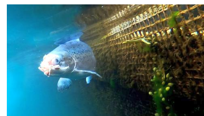
saumon en cage

Le mois a été occupé par la préparation d'une loi réorganisant l'aquaculture. Celle-ci est récente en Islande mais se développe très rapidement : de 161 tonnes en 1984, 3515 en 1994 elle est passée à 54789 tonnes en 2024 2 , dont 49203 tonnes de saumon. Les quotas étaient au total en 2025 de 116000 tonnes dont 72200 pour des entreprises opérant dans les fjords de l'ouest, en particulier ceux de Ísafjörður et Patreksfjörður. La loi en préparation a surtout pour objet une meilleure connaissance et un meilleur contrôle d'une activité dont la dangerosité pour l'environnement est bien connue. Ce sont trop de contraintes pour les