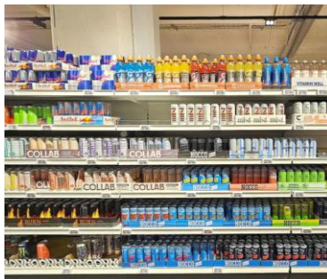
moins d'alcool, mais...

– 02/12 : selon un récent rapport concernant les habitudes alimentaires des peuples nordiques, 56% des adultes sont en surpoids ou obèses ; et 70% lorsqu'il s'agit d'Islandais . C'est aussi ces derniers qui consomment le moins d'alcool ! Est-ce une explication ?