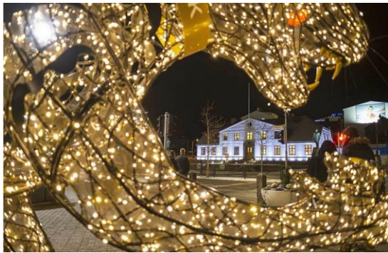
Jólakötturinn aux aguets

Ces lignes sont le résultat de lectures, de suggestions et d'informations que je peux obtenir autour de moi. Elles ne prétendent pas à l'objectivité et n'engagent que ma seule responsabilité. Vous pouvez aussi consulter mon blog sur https://www.sg-ms.net