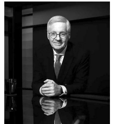
gott kvöld !