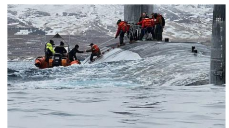
sauvetage d'un sous-marin ?

La question de la protection de l'île, largement évoquée dans ma précédente chronique, reste évidemment à l'ordre du jour et la presse fait volontiers état de sous-marins en exercice à proximité des côtes islandaises ; et aussi à l'opposition de 72% d'Islandais à