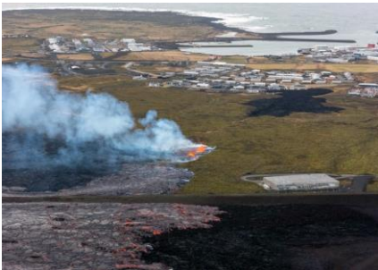
Grindavík – 1 er avril

Le 1 er avril, alors même que j'envoyais une chronique où j'annonçais une reprise de la vie à Grindavík, une nouvelle éruption se produisait à 500 mètres des premières maisons. Que vont décider les habitants ?