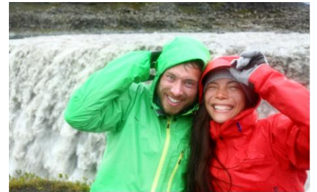
on les comprend !!!