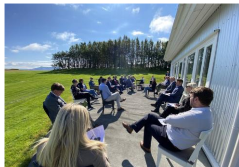
ministres et collaborateurs en réflexion

La semaine suivante le gouvernement presque au complet est en séminaire dans un hôtel du sud de l'île 3 . Un des employés est testé positif : l'hôtel est fermé et tous les ministres présents mis en quarantaine. Fort heureusement aucun d'eux n'est atteint.