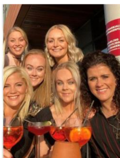
deux mètres ?

C'est en fait ce qu'annonce le gouvernement le même jour : les passagers arrivant à Keflavík seront testés deux fois, une à l'arrivée, une autre après une quarantaine de 4 à 5 jours. La décision est difficile et violemment contestée par les acteurs du tourisme. Katrín Jakobsdóttir, Premier Ministre, s'en explique dans une tribune parue dans Morgunblaðið 2 le 26 août et conclut : « depuis le début le choix du gouvernement islandais a été clair : assurer la vie et la santé de tous et le meilleur fonctionnement de notre communauté. »