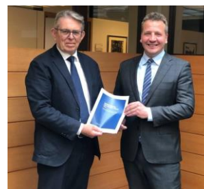
Björn et Guðlaugur Þór

Le 30 octobre 2019 les cinq pays nordiques avaient décidé de confier à Björn Bjarnason, ancien ministre (Parti de l'Indépendance), la rédaction d'un rapport sur la coopération entre les Pays Nordiques dans les domaines de la politique étrangère et de la sécurité 9 . Le rapport est remis le 6 juillet à Guðlaugur Þór Þórðarson, Ministre des Affaires Étrangères. Il est divisé en trois grands chapitres : les conséquences du changement climatique, les menaces « hybrides » (désinformation et tentatives d'influence, cyberattaques et autres menaces diffuses), le multilatéralisme et la diplomatie classique. Les domaines sont en effet nombreux dans lesquels des coopérations existent déjà mais doivent être actualisés et approfondis. Mais pour beaucoup d'entre eux, l'intensification de la coopération n'est envisageable que sur une base élargie prenant en compte les situations respectives des cinq pays vis-à-vis de l'Union Européenne, donc au final en acceptant une coopération plus étroite avec celle-ci.